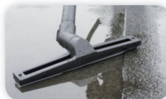
360 mm Nassbodendüse